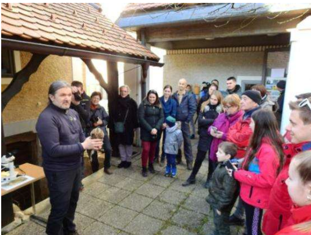
Slika 5: Predavanje v Podsredi pred izpustitvijo

Za boljše poznavanje sov, smo izdelali tudi plakat, ki smo ga delili zainteresiranim obiskovalcem, dobile pa so ga tudi šole, ki so vključene v Mrežo šol biosfernega območja.