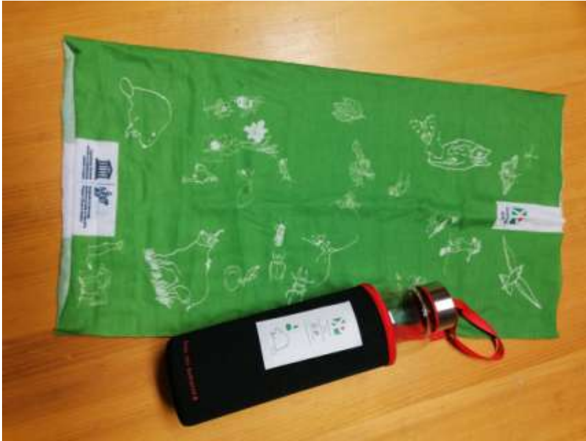
Slika 1: stekleni bidon in ovratni šal