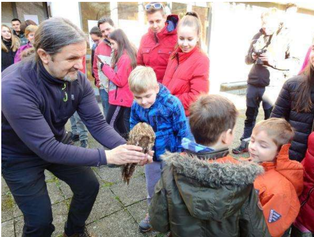
Slika 6: Pogumni so se lahko sove tudi dotaknili