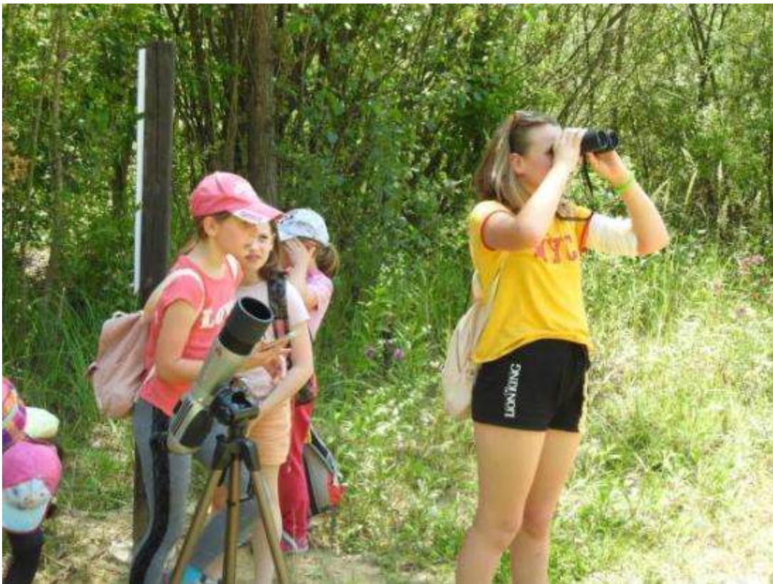
Slika 4: Mladi varuhi narave pri opazovanju čebelarja v Župjeku