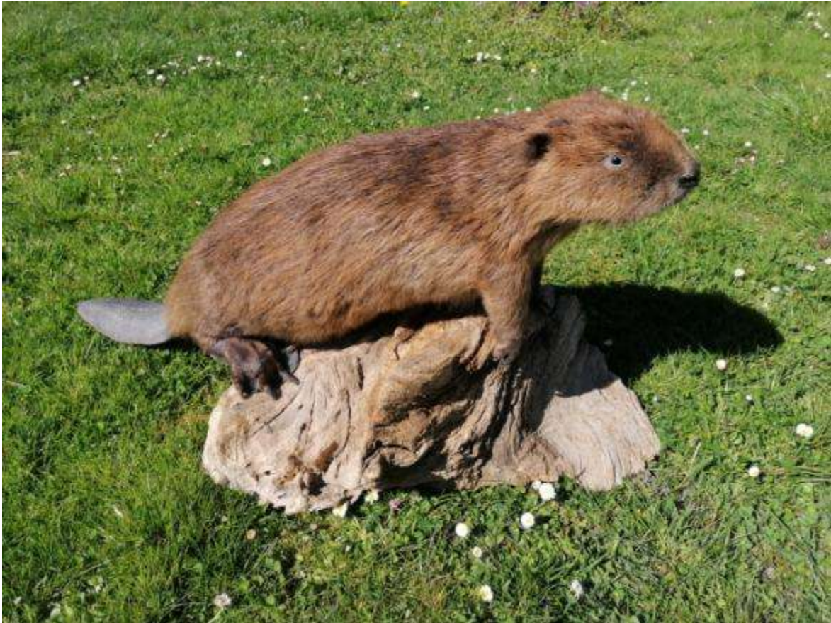
Slika 9: Dermoplastični preparat bobra