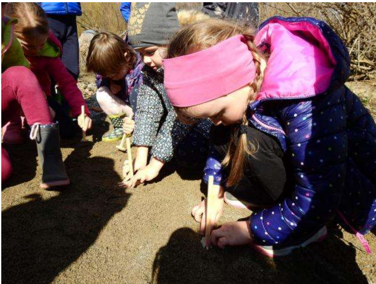
Slika 8: otroci so sledi bobrovih tačk odtisnili v pesek ob reki

Že marca pa so si sledove bobra ob reki Bistrici ogledali otroci iz vrtca Kozje.