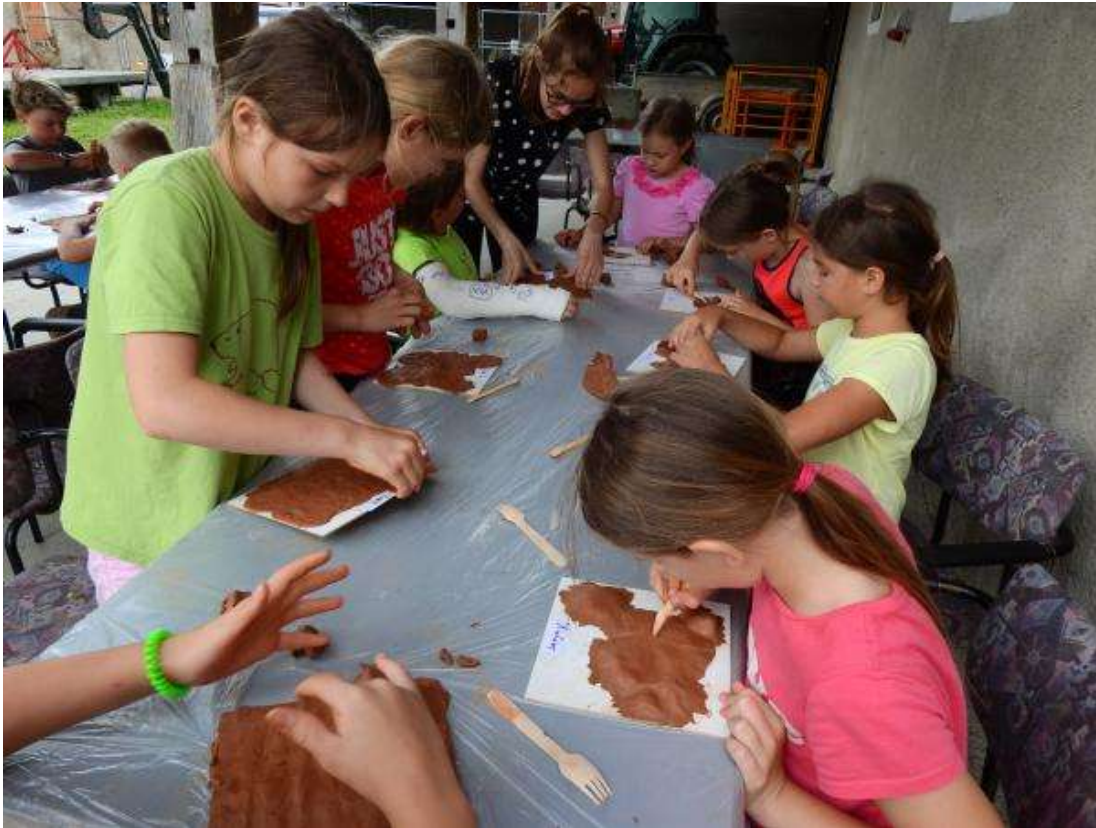
Slika 3: Oblikovanje pokrajine z glino