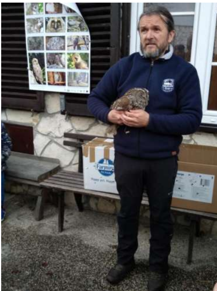
Slika 7: Predavanje o sovah na Lisci