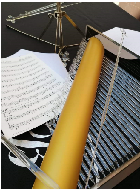
Matjaž Bornšek, klavir

Kozjanski park in Društvo steklarjev Slovenije vabita na odprtje razstave steklenih mojstrov članov Društva steklarjev Slovenije