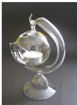
Zvone Drobnič, svečnik s čajno lučko

Grad Podsreda je odprt vsak dan razen ob ponedeljkih med 10. in 17. uro.