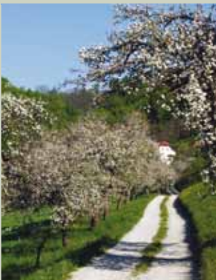
Sadni drevored nas pelje h kozjanski domačiji

Visokodebelni travniški sadovnjaki, evropsko pomembna varstvena območja Natura 2000, so izjemno pomemben življenjski prostor za ptice - zelena žolna, pogorelček, rjavi srakoper, pivka, vijeglavka, smrdokavra, sršenar in veliki skovik.