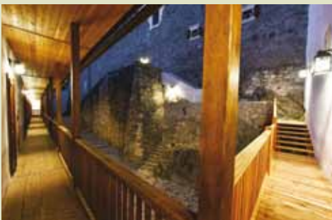
Čarobno notranje dvorišče