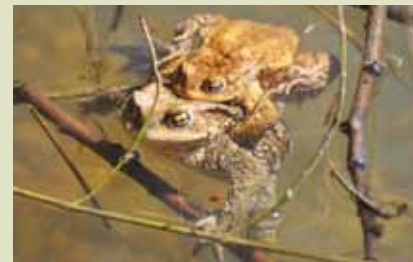
Ribnik je idealno mrestišče za krastače