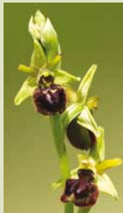
Osjeliko mačje uho