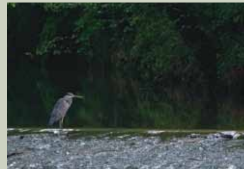
Siva čaplja rada prebiva ob reki Bistrici.