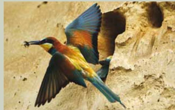
Čebelar – najbolj živopisan ptič v Sloveniji

V peskokopu Župjek pri Bizeljskem je gnezdišče živopisanega ptiča čebelarja ( Merops apiaster ). To zelo redko poletno vrsto lahko spremljamo iz opazovalnice pod gnezdilno steno od konca aprila do sredine avgusta.