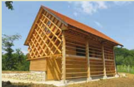
Ob kolekcijskem sadovnjaku nastaja center biodiverzitete.

Center biodiverzitete in tradicionalnega sadjarstva – na Čerčkovi domačiji nad Podsredo je kolekcijski sadovnjak Kozjanskega parka, kjer rastejo tradicionalne in avtohtone sorte jablan, hrušk in sliv. V drevesnici se vzgajajo sadike starih sort jablan in hrušk.