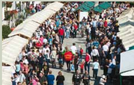
Praznik kozjanskega jabolka je največja naravovarstvena prireditev v Kozjanskem parku

Kozjanska jabolna ustvarja podobo krajine, kozjansko jabolko je postalo več kot sadež - je simbol ohranjene narave, izročila in prepoznavnosti zavarovanega območja Kozjanskega regijskega parka.