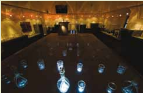
Razstava glažutarskega stekla