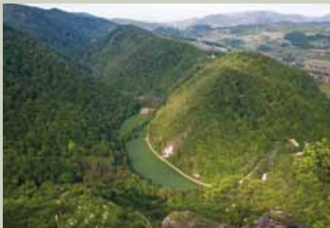
Soteska reke Bistrice

Reka Bistrica - med Trebčami in Zagajem je v dolžini 3 km zarezala najslikovitješo in najbolj ohranjeno rečno sotesko v vzhodni Sloveniji.