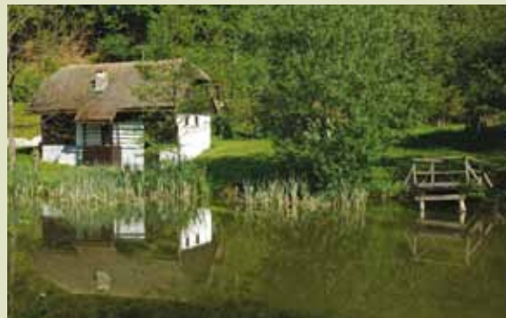
Ribnik Trebče s Kolarjevo domačijo

Ribnik na Trebčah je eno največjih mrestišč za dvoživke – žabe. Kolarjeva domačija ob ribniku, bližnji Senik ob reki Bistrici ter Javerškova domačija so močno povezani z življenjem Josipa Broza Tita in prikazujejo nekdanjo povezanost človeka z naravo.