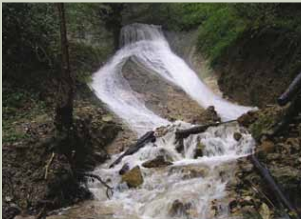
Ob deževju je slap v Gruski veličasten

Gruska – kras sredi nekraškega površja - največja, najstarejša, najpomembnejša geomorfološka površinska naravna vrednota državnega pomena v Kozjanskem parku je lep primer osamelega kraškega pojava.