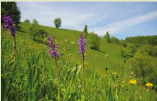
Suhi travniki na strmih pobočjih Vetrnika

Hribovski suhi travniki – zakladnica biotske pestrosti - sonaravno kmetovanje je ustvarilo enega najlepših in najbogatejših habitatov. Raznobarvni travniki so najlepši od maja do avgusta, oktobra pa lahko občudujemo gobji svet.