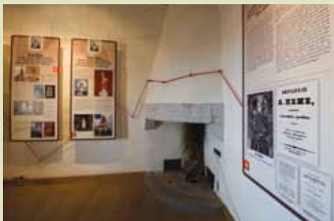
Emina spominska soba