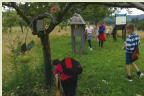
Sadovnjak si ogledajo številni šolarji.