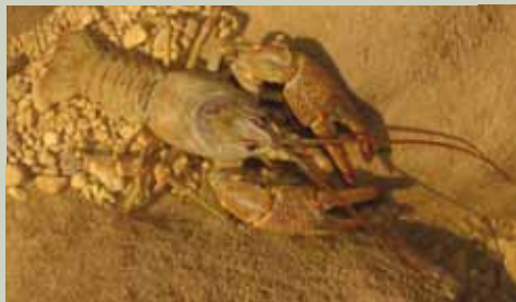
Potočni rak koščak

Reka Bistrica - med Trebčami in Zagajem je v dolžini 3 km zarezala najslikovitješo in najbolj ohranjeno rečno sotesko v vzhodni Sloveniji.