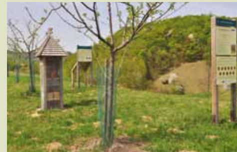
Informacijska točka v sadovnjaku je prirejena tudi za slepe in slabovidne.