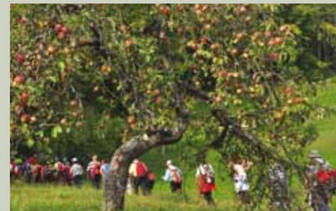
Prebivalci parka skrbijo za svoje travniške sadovnjake