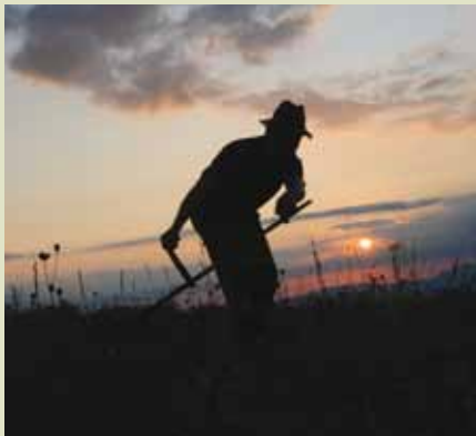
Hribovski kmetje obdelujejo naravovarstveno najpomembnejše habitate v Evropi