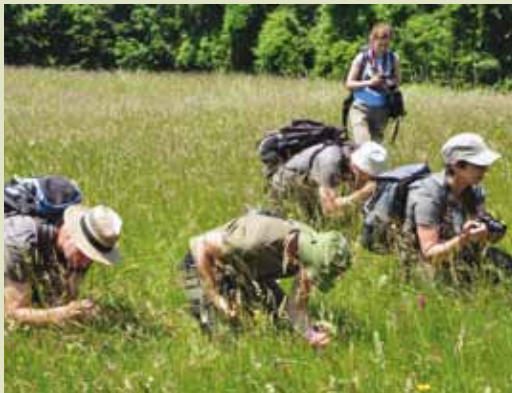
Suhi travniki so raj za raziskovalce, ljubitelje narave in fotografe

Center biodiverzitete in tradicionalnega sadjarstva – na Čerčkovi domačiji nad Podsredo je kolekcijski sadovnjak Kozjanskega parka, kjer rastejo tradicionalne in avtohtone sorte jablan, hrušk in sliv. V drevesnici se vzgajajo sadike starih sort jablan in hrušk.